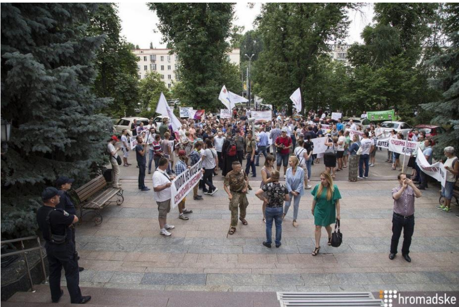
Рисунок 3. Мирний мітинг супротивників Маршу Рівності під Верховною Радою, 22.06.2018.

Праворадикальні націоналісти почали об'єднуватися з релігійними активістами у спробах блокувати проведення ЛГБТ заходів, однак власне релігійні активісти вдавалися до мирних форм протесту – таких, як ходи на "захист традиційної сім'ї" або мітинг під Верховною Радою проти проведення Маршів Рівності, що відбувся 22 червня і зібрав близько 300 учасників. Гасла учасників мітингу були підтримані народним депутатом від "Народного фронту" Юрієм Тимошенком. 24