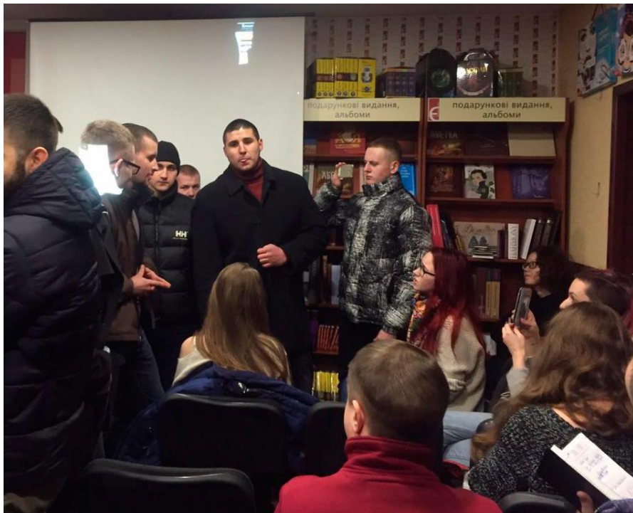
Рисунок 9. Блокування лекції про ЛГБТ рух у Харкові (кейс 1130).

У травні знову "Фрайкор", а також угруповання "Традиція і порядок" зірвали лекцію щодо гомофобії, організовану "Сферою". Поліція знову бездіяла.