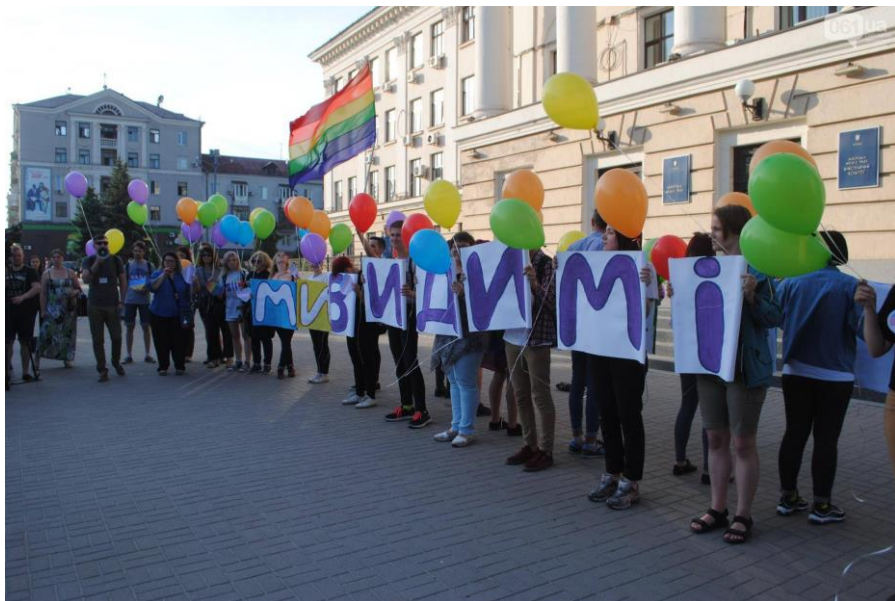
Рисунок 5. "Веселковий флешмоб" у Запоріжжі, 16.05.2018.

центром міста з веселковим прапором ЛГБТ, із символікою ЛГБТ на обличчі та плакатами, на яких зокрема було написано "Как можно ненавидеть за способность любить?". Одна з учасниць ходи постраждала від нападу невідомого чоловіка, який її сильно штовхнув, відібрав плакат, розірвав його на шматки і викинув. 44