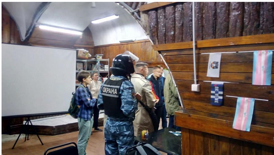
Рисунок 11. Блокування харківського ПрайдХабу (кейс 1326).