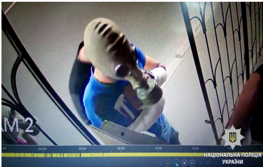
Рисунок 10. Напад на харківський ПрайдХаб (кейс 1254).

Поліція почала кримінальне розслідування за статтею 296 ККУ "Хуліганство". Мотив нетерпимості не був внесений до матеріалів розслідування.