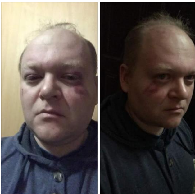
Рисунок 7. ЛГБТ активіст з Кривого Рогу після нападу невідомих (кейс 1102).

У липні один із цих активістів знову піддався нападу невідомих (кейс 1256). Цей злочин також досі не розкрито.