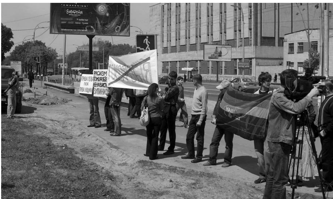
Пикетирование МАУП – учебного заведения, отчислившего студента из-за его сексуальной ориентации, Киев, май 2005