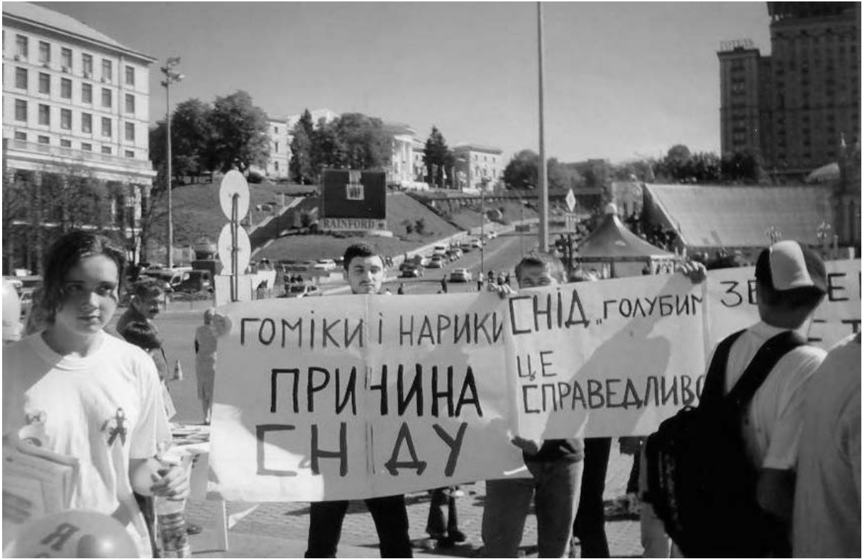
Включенное наблюдение за гомофобным пикетом, Киев, сентябрь 2003

В качестве инструмента используется карточка наблюдений – перечень вопросов, на которые наблюдатель старается получить ответы. Это помогает систематизировать наблюдения, гарантировать сопоставимость данных, полученных несколькими наблюдателями.