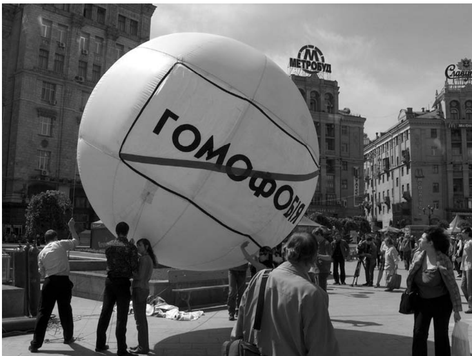
Запуск воздушного шара с антигомофобным лозунгом на центральной площади Киева в День противодействия гомофобии, май, 2005