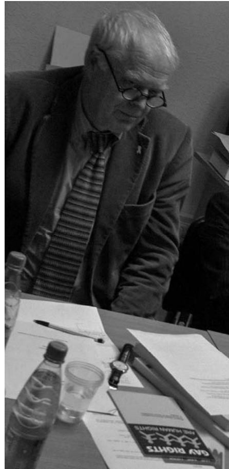
Изданный Центром "Наш мир" Отчет о соблюдении прав гомосексуалов в Украине перед Комиссаром по правам человека Совета Европы Т. Хаммарбергом