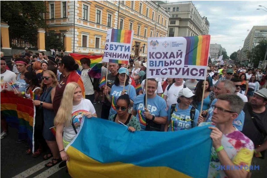
Рисунок 1. Колона Центру громадського здоров'я МОЗ України на Марші Рівності 2019 у Києві.

громадського здоров'я напередодні Маршу Рівності змінив заголовок своєї офіційної фейсбук-сторінки, додавши до нього сердечко у кольорах веселки, а його офіційна делегація взяла участь у самому марші – першими серед українських урядових інституцій.