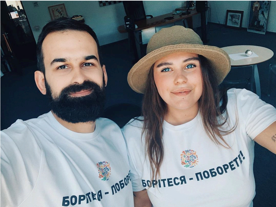
Рисунок 4. До інформаційної кампанії на підтримку прав ЛГБТ долучилися, зокрема, учасники музичного гурту KAZKA, який зараз дуже популярний в Україні та Росії.

Так само, не викликали громадського зацікавлення та обговорення спроби пов'язати з ЛГБТ новопризначених урядовців, зокрема прем'єр-міністра Олексія Гончарука та міністра економічного розвитку Тимофія Милованова.