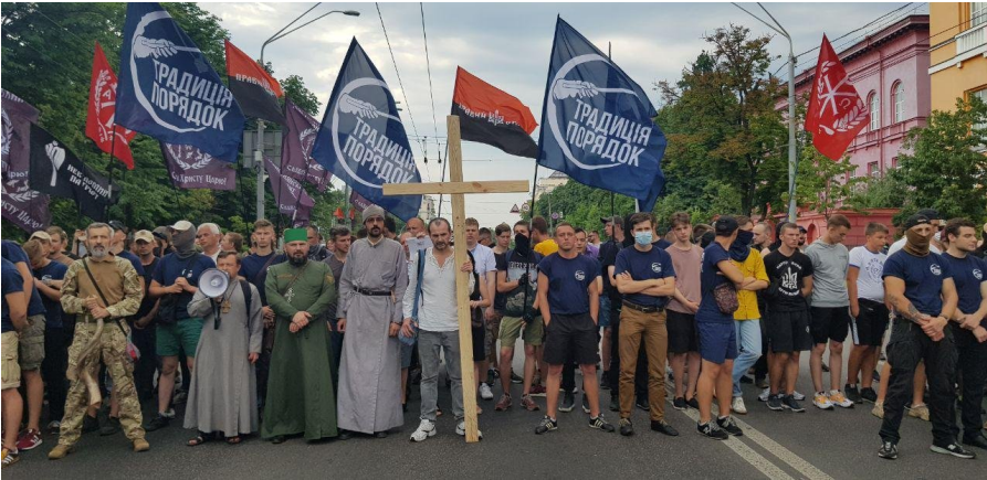
Рисунок 6. Священники різних церков брали участь у гомофобних акціях українських праворадикальних угруповань – зокрема, блокуванні Маршу Рівності 2019 у Києві.

незаконні прояви насильства проти громадян, які не підтримують традиційних християнських поглядів на сім'ю та громадську мораль". Хоча керівництво українських церков відмежовується від закликів до насильства та дискримінації проти ЛГБТ, воно не звертає уваги на те, що окремі священники активно співпрацюють з ультраправими гомофобними угрупованнями та беруть участь у їхніх акціях. 31