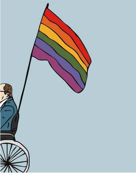
Рисунок 2. Карикатура на харківського мера Геннадія Кернеса, який зненацька вирішив не забороняти, а допомогати проведенню Маршу Рівності у місті.

вважає за потрібне забороняти його проведення. На питання, чому у мерії передумали, Геннадій Кернес відповів: "Чому? Тому що ми бачимо, що це такий захід, якому потрібно забезпечити безпеку. Ми не можемо обмежувати їм, заборонити". Мер навіть пообіцяв сприяти проведенню цього заходу. 13