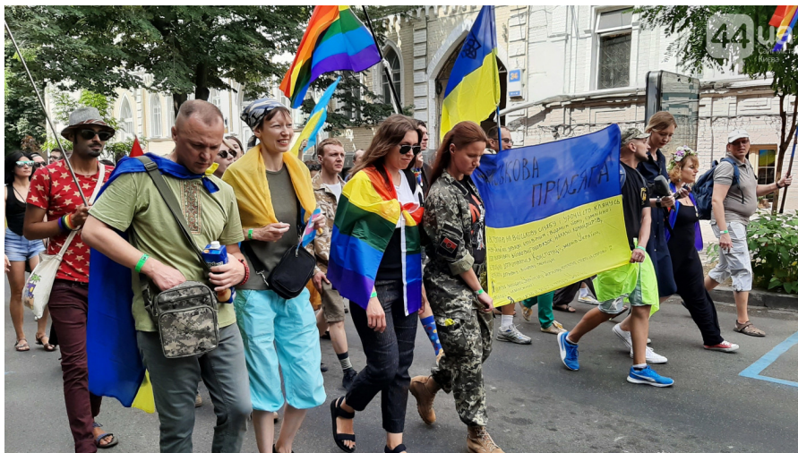
Рисунок 8. Група ветеранів і волонтерів АТО на Марші Рівності, Київ, 2019.

у скрутних життєвих обставинах, через нестачу коштів на його утримання. 47 Водночас, НУО "АЛЬЯНС.ГЛОБАЛ" відкрило у Києві аналогічний шелтер, але він є доступним тільки для геїв, бісексуалів та інших чоловіків, що мають секс із чоловіками, а також трансгендерних людей. 48 Маріупольська НУО "Істок" оголосила про відкриття першого ЛГБТ-центру у цьому місті. 49