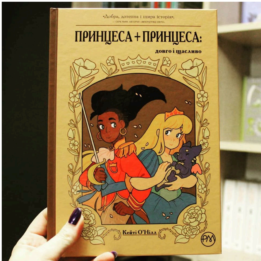
Рисунок 5. Комікс про кохання двох принцес, опублікований київським видавництвом "Рідна мова".