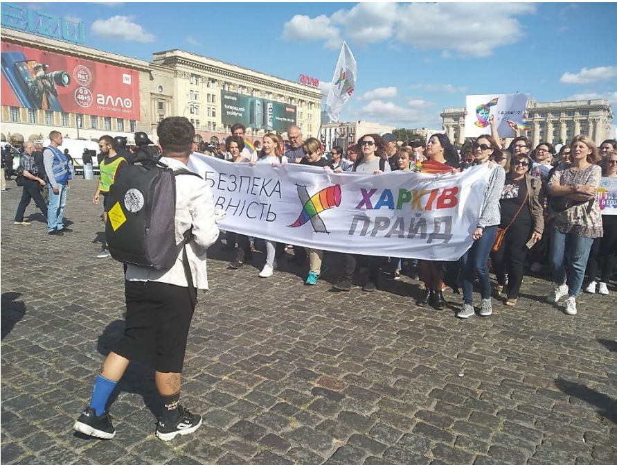
Рисунок 7. Марш Рівності, 15.09.2019, Харків, площа Свободи.

порядку під час проведення запланованих ЛГБТ заходів у місті. Міська влада Харкова, яка спочатку хотіла заборонити проведення маршу через суд, врешті погодилася забезпечити його проведення. 38 Незважаючи на очікувані контракції з боку ультраправих угруповань, які дуже активно діють у Харкові, учасникам маршу вдалося пройти частину запланованого маршруту під надійною охороною поліції. У марші взяли участь від 2 тисяч (за даними поліції) до 3 тисяч (за оцінками організаторів заходу) осіб, яких охороняло близько 2,5 тисяч поліцейських від декількох сотень агресивних опонентів. 39