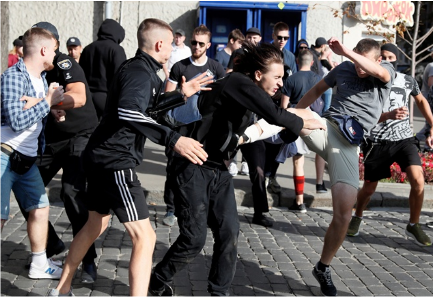
Рисунок 9. Напад, ймовірно учасників ультраправих угруповань, на учасника першого Маршу Рівності у Харкові.

а також тих, кого з ними асоціювали, з боку учасників таких ультраправих угруповань як "Традиція і порядок" та "Фрайкор".