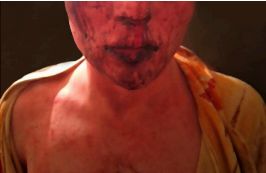
Рисунок 10. Жертва трансфобного нападу в Житомирі у квітні 2020 року (кейс 1872).

Молода трансгендерна особа постраждала від нападу трьох молодиків у Харкові наприкінці квітня 2020 року: правопорушники прийняли її за звичайну дівчину, а коли з'ясувалося, що це не так, побили та зламали їй носа. Ще на місці злочину постраждала викликала поліцію, але та нікого не змогла знайти. Того самого дня потерпіла подала заяву до Київського ВП ГУНП у Харківській області. До Центру "Наш світ" вона звернулася майже через місяць – тоді й з'ясувалося, що її заява так і не була зареєстрована, а "знайшлася" вона лише 26 травня, коли інформація про цей злочин та бездіяльність поліції набула розголосу в медіа. Тільки після цього було відкрито кримінальне провадження, але лише за статтею "Легке тілесне ушкодження", а мотиви нетерпимості правоохоронці, як зазвичай, проігнорували. На кінець 2020 року досудове слідство ще не було закінчено.