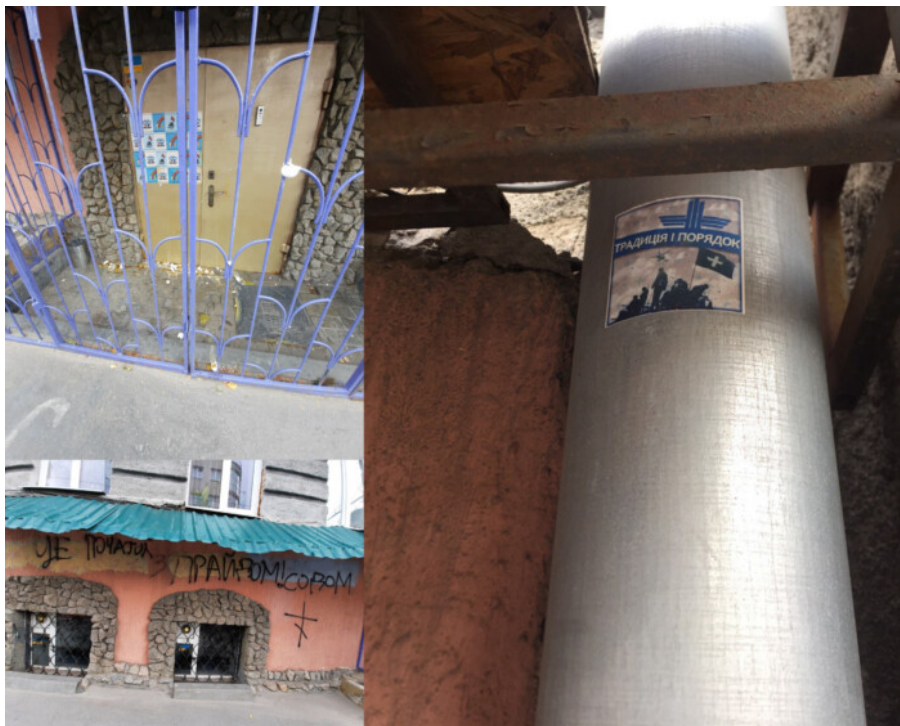
Рисунок 7. У 2020 році прибічники праворадикального угруповання "Традиція і порядок" неодноразово здійснювали напади на "Прайд-Хаб" у Харкові, залишаючи на його стінах гомофобні написи та наліпки своєї організації.

У 2020 році було зафіксовано 20 майнових злочинів, коли жертви цілеспрямовано обиралися через свою сексуальну орієнтацію / гендерну ідентичність для вимагання, шантажу, розбою або грабежу, а також одне вбивство на ґрунті побутової гомофобії під час спільного вживання алкоголю.