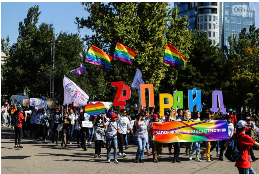
Рисунок 6. 20 вересня 2020 року у Запоріжжі пройшов перший Марш Рівності.

активістів та двоє поліцейських. Поліція затримала 16 нападників, звинувативши їх за статтями 173 (Дрібне хуліганство) та 185 (Злісна непокоря законному розпорядженню або вимозі поліцейського) Кодексу України про адміністративні правопорушення. 48