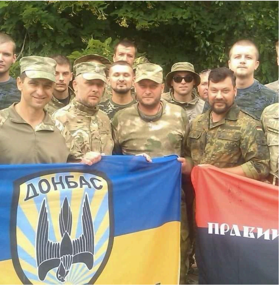
Рисунок 2. Праворадикальний політик Дмитро Ярош (третій зліва у першому ряді) стверджував, що не бачив ЛГБТ на війні. Зліва від нього у другому ряді (із заплещеними очима) стоїть доброволець гей Віктор Пилипенко.

Відомий український політик і гомофобний ультраконсервативний релігійний активіст Олександр Турчинов приєднався до партії "Європейська Солідарність", очоливши її передвиборчій штаб. Це може посилити ультраконсервативне крило всередині цієї політичної сили, але з попереднього досвіду її роботи відомо, що партія в цілому не має офіційної політики з ЛГБТ питань, а її керівництво хоч і не підтримує, але й не заважає про-ЛГБТ ініціативам її членів і депутатів її фракції у ВРУ.