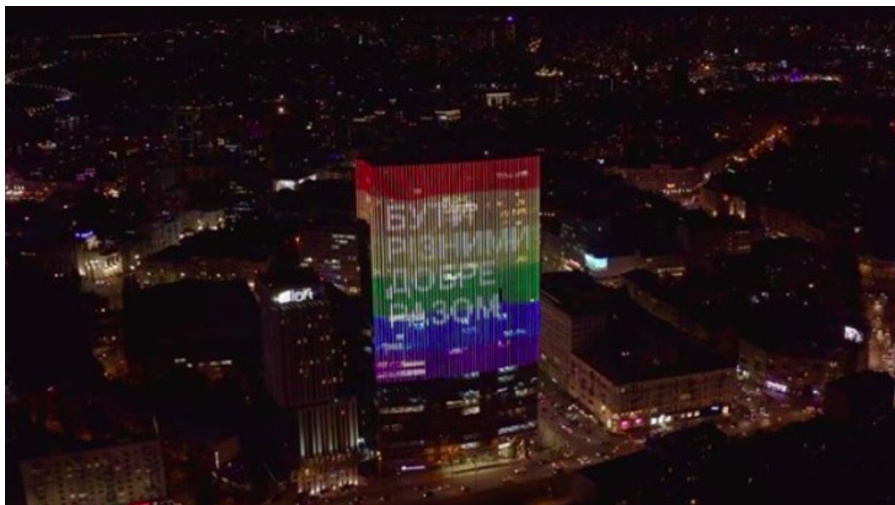
Рисунок 5. 5-8 жовтня 2020 року фасад ТРЦ Gulliver у Києві прикрашали кольори веселки та слоган "Бути різними добре разом!"

без перешкод з боку ультраправих угруповань, які у той самий час проводили свої заходи в інших місцях міста. Взагалі ж, агресивні опоненти ЛГБТ у Харкові (здебільшого, ультраправе угруповання "Фрайкор") у 2020 році демонстрували високу активність і неодноразово здійснювали напади на ЛГБТ заходи і приміщення, де вони проходили. 46