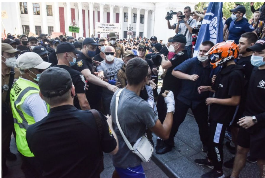
Рисунок 9. Сутички праворадикалів з поліцією під час нападу на мирну ЛГБТ акцію в Одесі, 30.08.2020.

Також жертву катували та вимагали гроші. Ні орган досудового слідства (СВ Житомирського РВП Житомирського ВП ГУНП в Житомирській області), ні процесуальне керівництво розслідування (Житомирська міська прокуратура) не побажали розглядати трансфобний мотив цього злочину. Наразі у Кримінальному кодексі України лише стаття 161 "Порушення рівноправності громадян залежно від їх расової, національної належності, релігійних переконань, інвалідності та за іншими ознаками" дозволяє враховувати гомофобний /трансфобний мотив при скоєнні злочину. У цьому випадку, відомості про скоєння злочину за цією статтею були внесені до ЄРДР лише за рішенням слідчого судді, і те не відразу. Так само, адвокатка потерпілої особи була вимушена звернутися до слідчого судді, щоби примусити слідство розслідувати факт зґвалтування. Навіть через чотири місяці розслідування, жодній з осіб, причетних до скоєння цього злочину (яких було встановлено слідством майже відразу), не було вручено підозру та не обрано досудового запобіжного заходу.