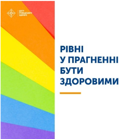
Рисунок 1. Ілюстрація до оголошення про проведення віртуального Маршу Рівності у Києві на ФБ-сторінці Центру громадського здоров'я МОЗ України.

упереджене та гомофобне ставлення громадської бюджетної комісії, яка розглядала проєктні заявки. 13