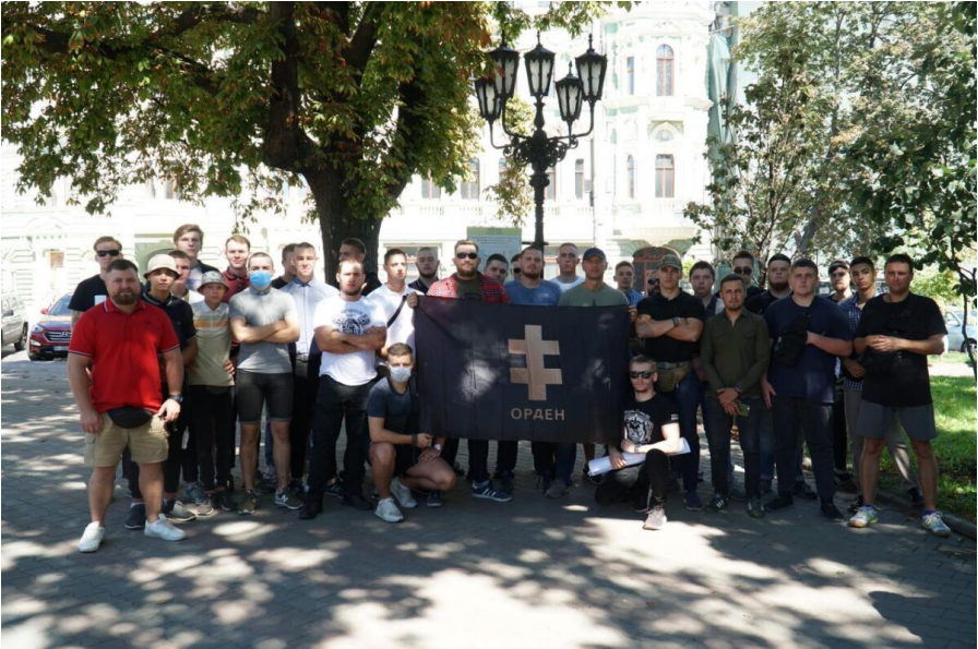
Рисунок 4. Демонстрація релігійних ультраправих активістів за "традиційні сімейні цінності", Одеса, 30.08.2020.

єпископату з критикою їхнього хибного шляху. Втім, коментуючи цей лист, представники керівництва РКЦ в Україні зауважили, що не мають великих сподівань переконати своїх німецьких одновірців, яким дуже вдячні за велику фінансово-матеріальну допомогу, яку вони від них отримували та продовжують отримувати. 34