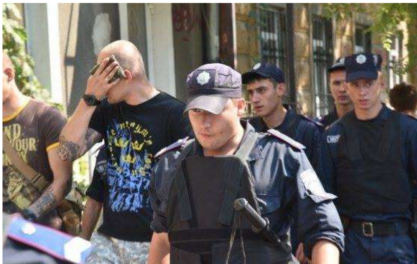
На фото: задержанные неонацисты.

Краткое описание инцидента с индикаторами предвзятости: На помещение, где собралось более 50 участников культурного ЛГБТ-фестиваля, представители СМИ и международных организаций напало около 30 молодых людей в масках и забросали помещение шумо-дымовыми гранатами.