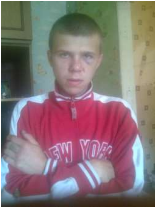
Фото нарушителя с его страницы в социальной сети «В контакте» ( https://vk.com/mc_foma )

Краткое описание инцидента с индикаторами предвзятости: Пострадавший, 30-летний гей, познакомился в одной из групп соцсети «В контакте» с нарушителем и договорился о встрече на съемной квартире. Вечером 20 октября, когда они встретились, нарушитель, угрожая ножом, ограбил пострадавшего и заставил признаться на камеру в якобы желании совратить несовершеннолетнего, а также «раскаяться» в гомосексуальности. Кроме этого, приказал передать привет «Модному приговору». Видео было выложено им на своей странице